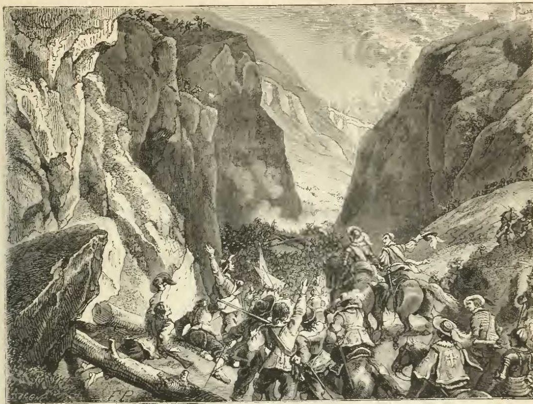
Richelieu forçant le Pas de Suse.

La première partie du programme de Richelieu était accomplie. Les grands étaient abaissés, et le parti huguenot ruiné.